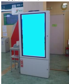
NEXCO東日本 三芳PA Ⓔ