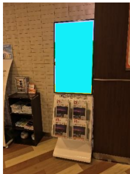
NEXCO中日本 足柄SA Ⓔ